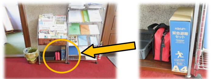
泣き部屋入口横の書架に置いています

いざという時のために、備付け場所をご確認ください。また、聖堂及び伝道館には緊急時の避難経路を設定しており、案内を掲示しています。安全かつ円滑に避難できるよう、皆さんそれぞれの目で確認いただくようお願いします。