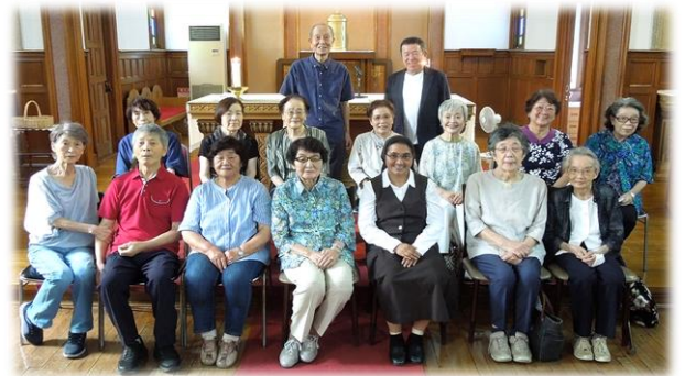
集会祭儀には17名の方がお集まりくださいました

集会祭儀のあと伝道館に集まり、茶話会を開催しました。「祖父母と高齢者のための世界祈願日」の祈りを唱えた後、若き日に皆さんが口ずさんだことのある思い出の聖歌、『あめのきさき』『あおばわかばに』『サンクトゥス』を全員で歌い、そして近況を語り合い、楽しいひと時を過ごしました。